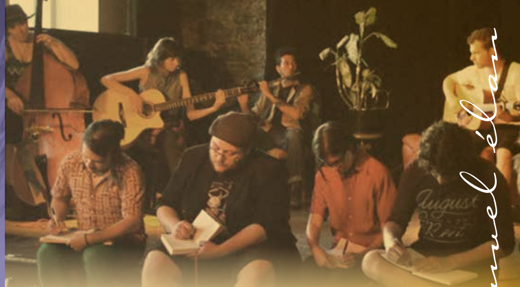
Centre communautaire et résidentiel Jacques-Cartier