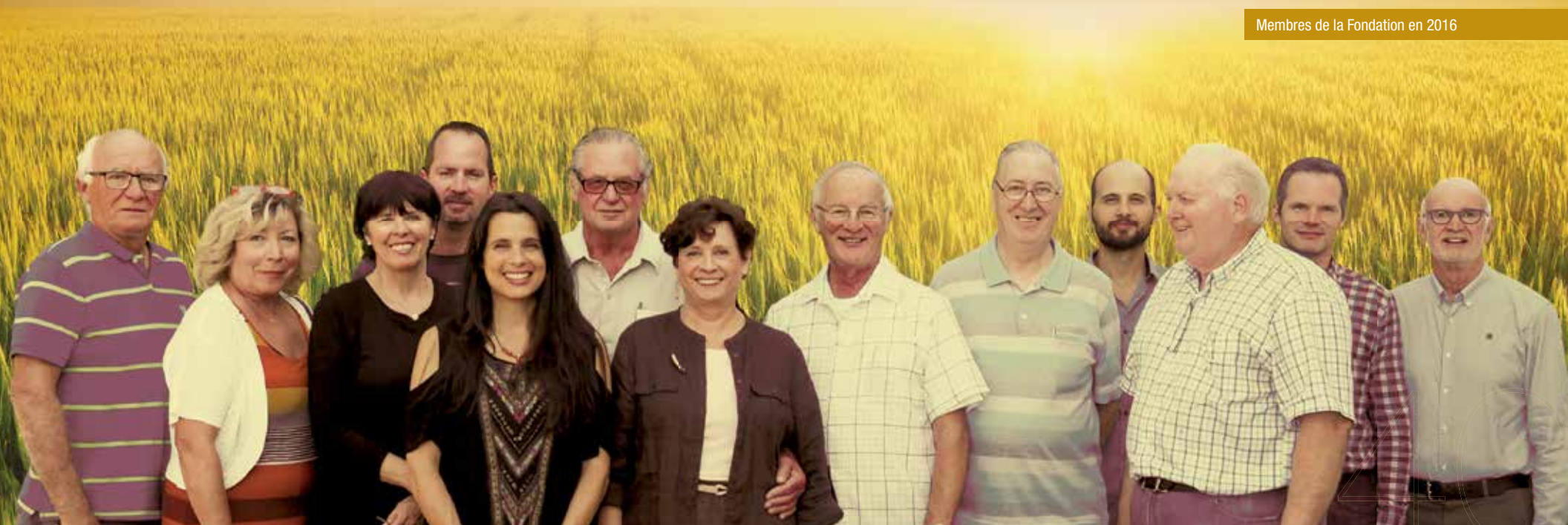
Membres de la Fondation en 2016