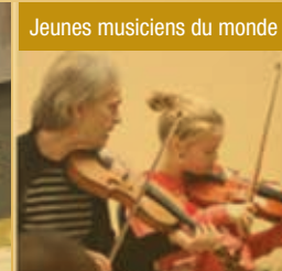
Centre famille Haute-Ville